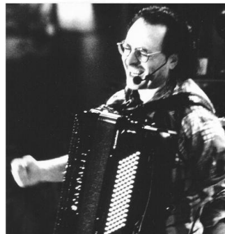
EDUARDO DE CRESCENZO Live /Giungla records - BMG